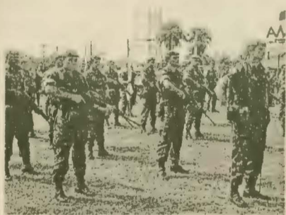
Salva de tiros feita pelos soldados do 34° BIS