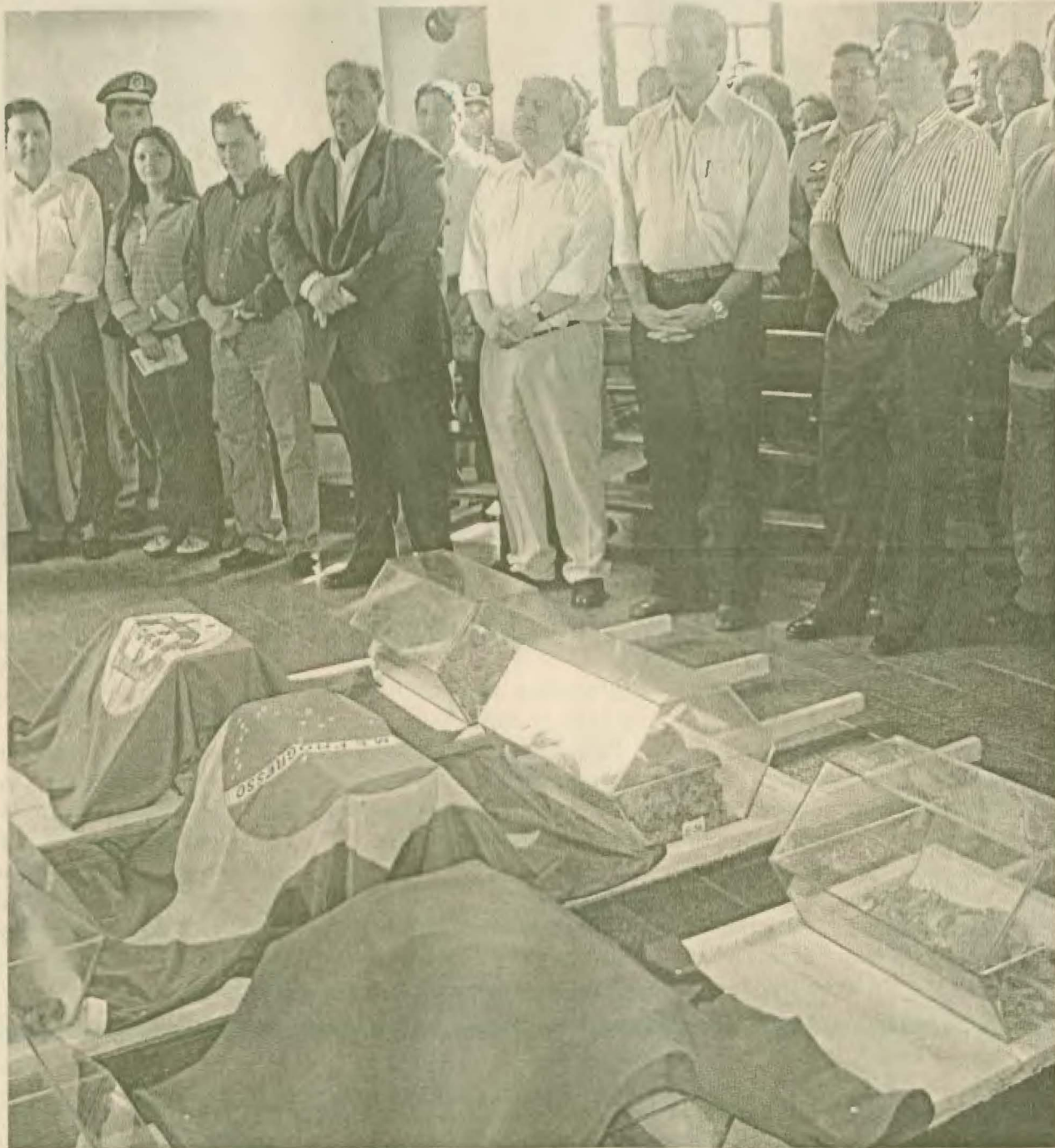
Durante a missa campal, os restos mortais de brasileiros, marroquinos e portugueses foram abençoados

O evento contou com uma missa campal, realizada na igreja Nossa Senhora da Assunção, onde foi celebrada pelo padre Ângelo Da Ma-