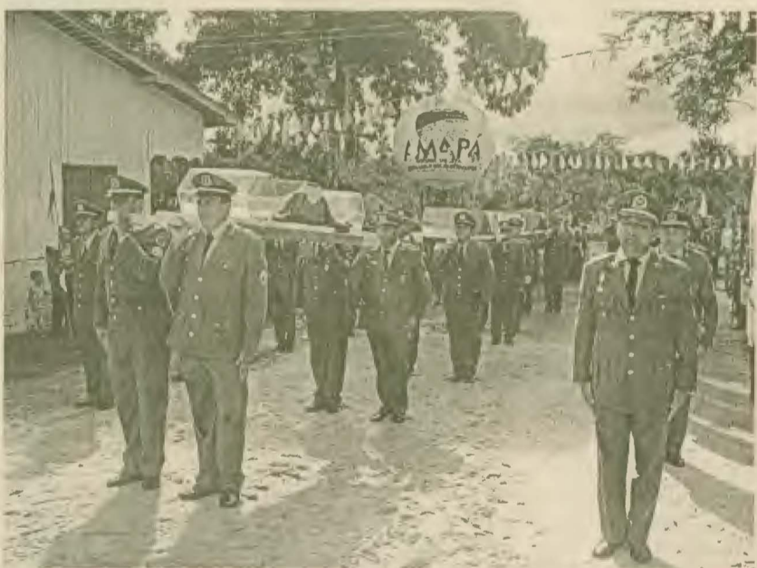
Cortejo fúnebre, com nove urnas representando todas as ossadas descobertas