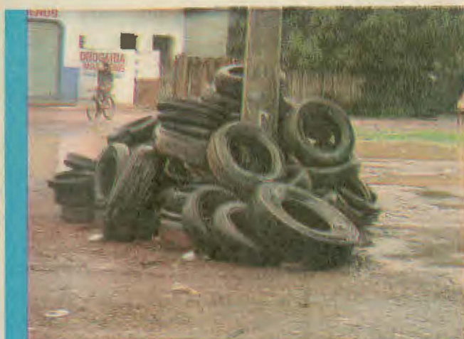
Sem ajuda da população, é impossível combater os mosquitos