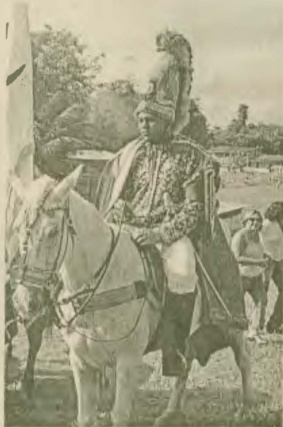
Cavaleiros de São Tiago deram início à programação