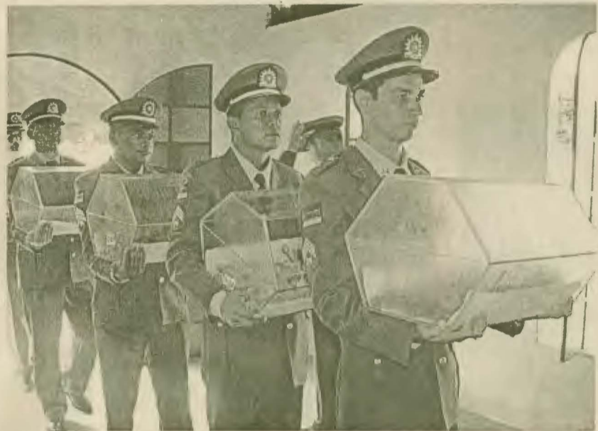
As urnas foram guardadas em um mausoléu, construído especialmente para a descoberta arqueológica