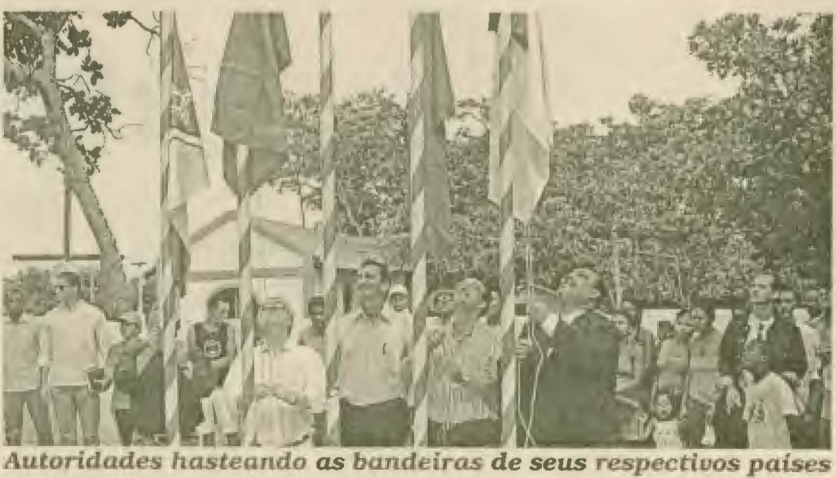
Autoridades hasteando as bandeiras de seus respectivos países