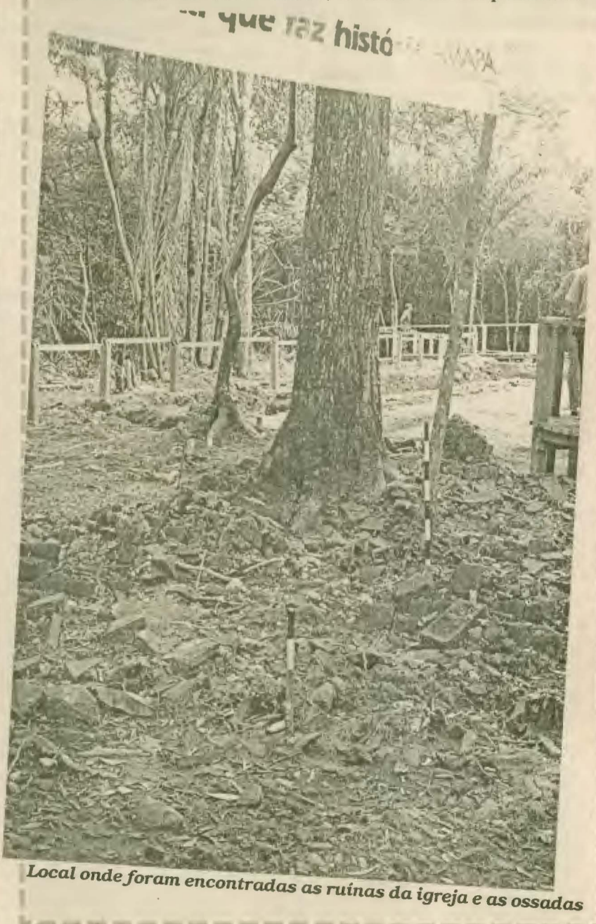
Local onde foram encontradas as ruínas da igreja e as ossadas

Além de ser responsável pela restauração da Fortaleza de São José de Macapá e pelo sítio arqueológico da cidade de Mazagão Velho, a equipe do arqueólogo tem cuidado da Vila Vistosa, cidade contemporânea.